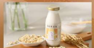
圖為A.A. Clean Label 無添加發展促進會