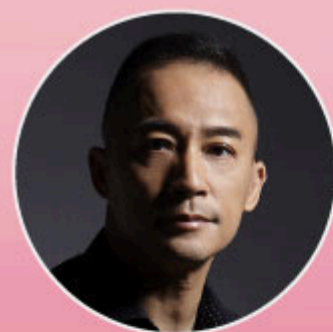
主講人 洪震宇 作家、創意教練